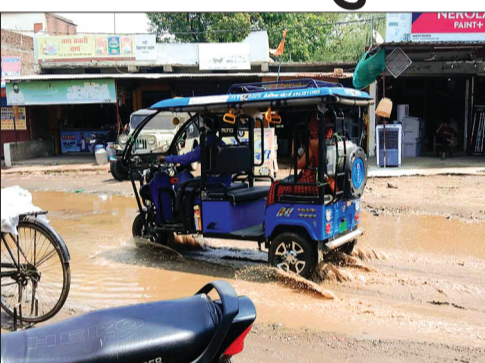
सड़क नाले में तब्दील हो गई। अब निकलने के लिए मजबूर हो रहे हैं। रहागीर और ग्रामीण पानी में से

हरिभूमि न्यूज ▶ अहमदपुर अहमदपुर में मौसम परिवर्तन होने से हवा आंधी के साथ वर्षा होने के कारण लोगों के लिए अब समस्याएं बन गई। क्योंकि अहमदपुर में 3 दिन से लगातार बारिश होने से ग्रामीण क्षेत्र में गर्मी के बाद सर्दी का एहसास महसूस होने लगा है। बारिश होने के कारण ग्रामीण क्षेत्र में बार-बार बिजली की कटौती हो रही है। अहमदपुर में बे मौसम हुई वर्षा से सड़कों के ऊपर पानी भरने लगा है, जिससे अहमदपुर, चरनाल मार्ग पर