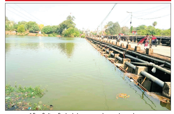
आष्टा। पार्वती नदी में पानी छोड़ने के बाद अब हो रहा ओवरफ्लो।